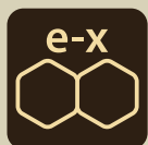
diòxid de sofre i sulfits